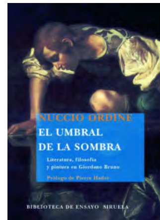
El umbral de la sombra Nuccio Ordine

SIRUELA EAN: 9788498412208 Rústica 384 páginas PVP: 28,90 €