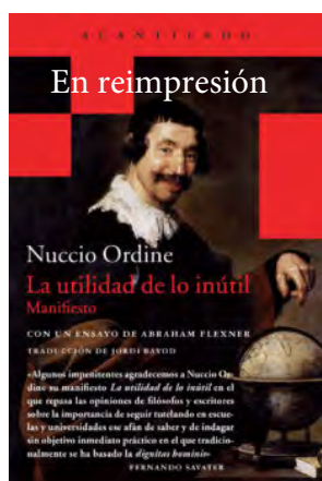
La utilidad de lo inútil Nuccio Ordine

ACANTILADO EAN: 9788415689928 Rústica 176 páginas PVP: 10 €