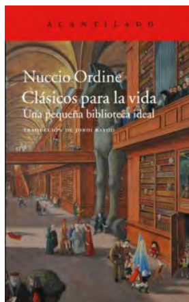
Clásicos para la vida Nuccio Ordine

ACANTILADO EAN: 9788416748648 Rústica 192 páginas PVP: 12 €