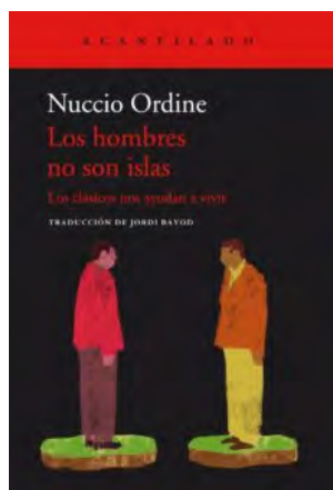
Los hombres no son islas Nuccio Ordine